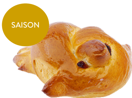
Pfingsttaube fürs Pfingstfest