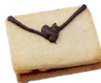
Mini Briefli Konfi Füllung