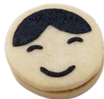
Mini Lara Konfi Füllung