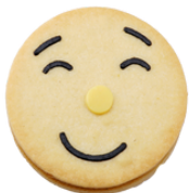
Joy Konfi Füllung

Das feine Standard-Sortiment unseres Spitzbuebs mit verschiedenen Gesichtern und Motiven ist mit fruchtiger Konfitüre oder einer zart schmelzenden Pralinencreme Füllung erhältlich.