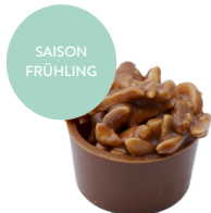
Rocher im Chübeli