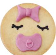
Eva Konfi Füllung