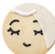
Pam Konfi Füllung