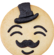
Teo Konfi Füllung