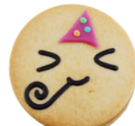
Bob Konfi Füllung