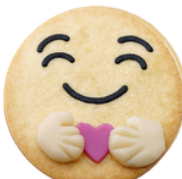
Zoe Konfi Füllung