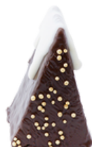
Tannenbaum Kuchen mit goldenen oder silbernen Kugeln