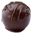
Vanille Truffes dunkel

Unsere feinen Pralinen sind in liebevoller Handarbeit mit erlesenen Rohstoffen und natürlichen Zutaten hergestellt. Wir beziehen unsere Couverture bei der Firma Felchlin. Eigenkreationen sind auf Anfrage möglich.