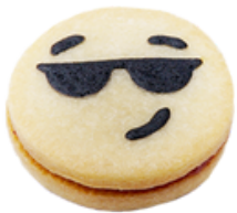
Mini Vinz Konfi Füllung