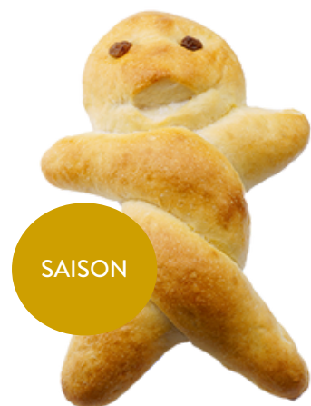
Gritibänz für die Adventszeit