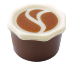
Knospe mit Caramel