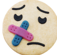
Pit Konfi Füllung