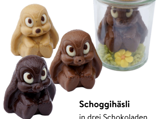
Schoggihäsli in drei Schokoladen Arten erhältlich