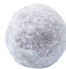
Champagner Truffes (alkoholhaltig*)