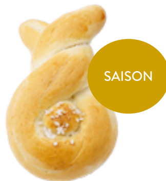
Znüni Osterhase Varianten fürs Osterfest