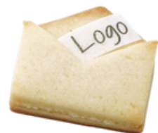
Mini Briefli mit Danke oder Logo bedruckt ohne Füllung

Unterstützen Sie mit Ihrem Dankeschön Menschen in der Arbeitsintegration