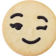
Lea Konfi Füllung