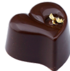
Salted Caramel Herz