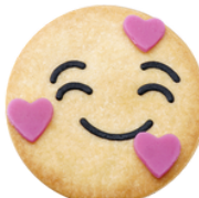
Liv Konfi Füllung