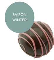
Glühwein Truffes (alkoholhaltig*)