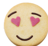
Amy Konfi Füllung