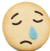
Ela Konfi Füllung