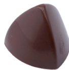
Pflaumen Portwein Marzipan (alkoholhaltig*)