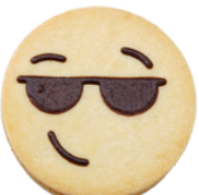
Vinz Konfi Füllung