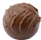
Milch Truffes hell