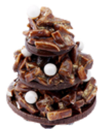
Tannenbaum Confiserie mit weissen Kugeln und Goldstaub